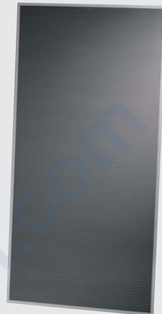
Solarmodul der Serie FS 2