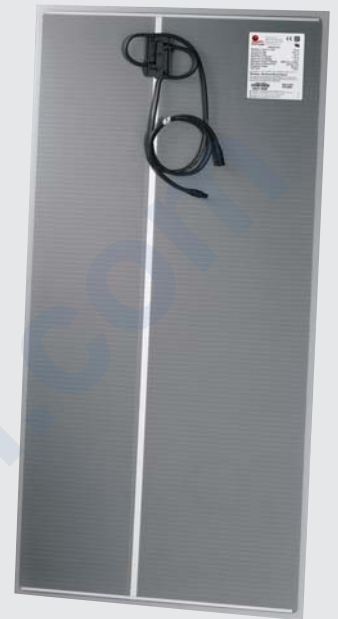
Solarmodul der Serie FS 2